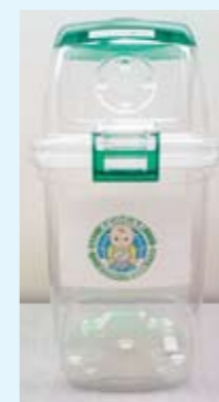
エコキャップ回収BOX

2008年からペットボトルキャップの回収を行っているんだよ。回収したキャップは、リサイクルの会社に買い取ってもらって、貧困に苦しむ世界の子どもたちを支援する団体「エコキャップ推進協会」を通じて、ワクチンが途上国へ寄付されるんだ。2010年3月までに合計約160万個のキャップを回収し、約2,000人にワクチンを届けることができたんだ。今後もこの活動を継続するから、みんなもエコキャップ運動に参加してね。