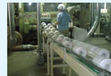
トイレtpペーパーに再生

ショッピングセンターで発生した白色の古紙類は、沖縄島内の紙をつくる工場にわたしているんだ。そして、トイレtpペーパーに再生してもらい、ショッピングセンターで使っているんだよ。しかもこのトイレtpペーパーは、古紙100%なんだ。沖縄島内で資源を循環させることって大切だよ。