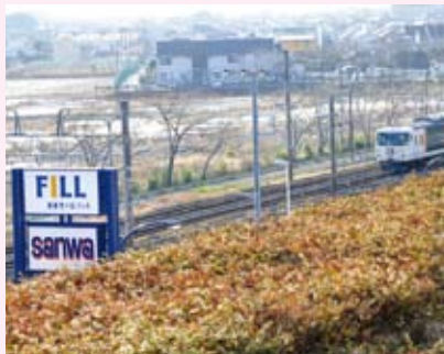
おくじょうみどりすす 屋上緑化

屋根が暖まらないようにするために、屋上緑化をしています。施設の前を走る鉄道からも湘南モールフィルのあちこちに生い茂っている緑が見えます。見た目も涼しげですが、屋上緑化をすることで、冷房に使うエネルギーが少なくて済み、排熱も少なくなります。ヒートアイランド対策に効果があるんですよ。