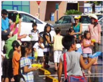
うちみずだいさくせん 打ち水大作戦

2010年8月1~3日に打ち水大作戦を行いました。駐車場に打ち水をして、ヒートアイランドを冷まそうという試みです。たくさんのお客さまと一緒に水をまいたとたん、サッと温度が冷えた感じがして、本当に気持ちよかったです。周辺の気温は何度下がったと思いますか? 約2度も下がったんですよ!